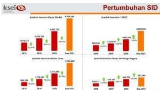
Grafik 1. Pertumbuhan Pasar Modal di Indonesia

Pasar modal dapat menjadi pilihan yang efektif untuk merangsang pertumbuhan ekonomi di Indonesia pada saat ini. Pasar modal sendiri menjadi incaran investor dari dalam dan luar negeri. Hal tersebut disebabkan terdapat minat investor yang tinggi hingga berdampak pada peningkatan penjualan dan pembelian saham di pasar modal. Berikut ini adalah grafik untuk pertumbuhan pasar modal yang dapat ditunjukkan pada gambar di bawah ini: