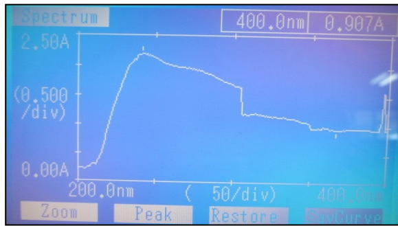
GAMBAR 3. Spektrum UV-Vis fraksi No. 61 ekstrak etanol daun sirsak dengan penambahan AlCl_3 .

Keterangan: fraksi dalam etanol+ AlCl_3 dengan \lambda_{maks} 242 nm (pita II).