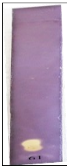
GAMBAR 1. Profil KLT fraksi ekstrak etanol daun sirsak setelah disemprot DPPH (1,1-diphenyl-2-picrylhidrazil).