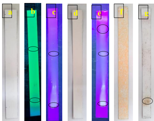
Gambar 1. Hasil uji KLT hasil fermentasi kulit buah naga yang telah diuapkan 8 \mu l dengan fase gerak n -butanol, asam asetat dan air (4 : 1 : 5)

larutan hasil fermentasi kulit buah naga merah. Berdasarkan hasil orientasi larutan fermentasi diuapkan terlebih dahulu hingga membentuk ekstrak, larutan fermentasi yang tidak diuapkan dan langsung diuji KLT tidak ada bercak noda. Hal ini disebabkan kadar senyawa metabolit sekunder yang terdapat di dalam larutan fermentasi terlalu kecil, sehingga perlu dimurnikan dengan cara diuapkan dan menghasilkan ekstrak kering. Ekstrak kering dilarutkan dengan etanol 96% dan air perbandingan 7:3 dengan konsentrasi 5% dan volume penotolan 8 \mu l setelah itu dieluasi menggunakan fase gerak n -butanol, asam asetat dan air perbandingan 4:1:5 (Gambar 1).